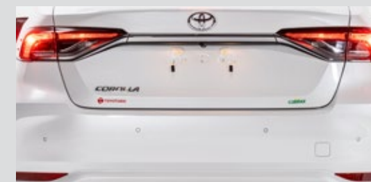
SENSORES DE ESTACIONAMIENTO DELANTEROS Y TRASEROS

El Corolla , en todas sus versiones, adoptó el centro multimedia Toyota Play como estándar. En otras palabras, desde la versión GLI hasta Altis, el automóvil tendrá una pantalla touch de 8 pulgadas, radio AM / FM, MP3, entradas USB, bluetooth, conexión para teléfonos inteligentes y tabletas con Android Auto y Apple Car Play, además de poder duplicar la pantalla del teléfono a través de Mirror Link.