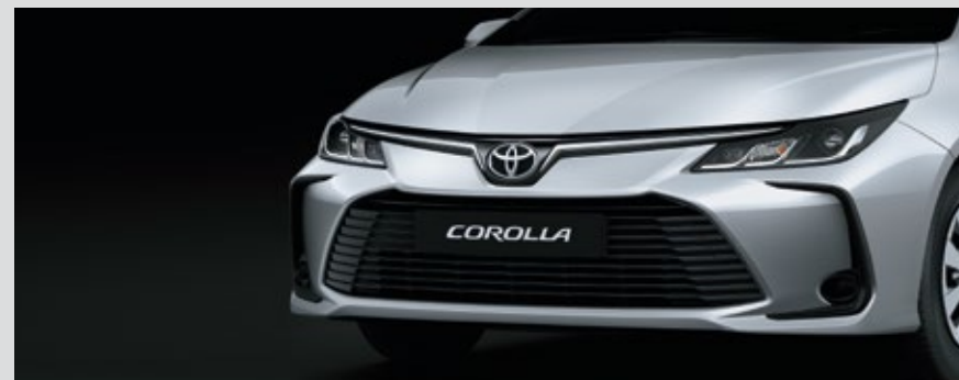
NUEVO FRENTE AERODINÁMICO