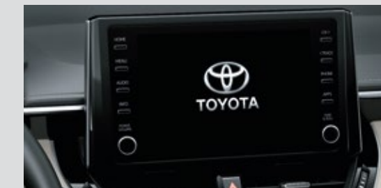
RADIO CON BLUETOOTH, APPLE CARPLAY Y ANDROID AUTO

La versión híbrida, además presenta el exclusivo paquete de seguridad activa Toyota Safety Sense, que incluye Alerta de salida de carril (LDA), Control de crucero adaptativo (ACC), Luces altas automáticas (AHB) y Pre-Collision System (PCS) con alerta audible y visual y, si es necesario, frenado automático.