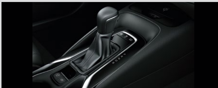
CVT DE 8 VELOCIDADES