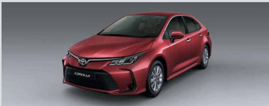
NUEVO COROLLA GLI - MOTOR DYNAMIC FORCE 2.0 L FLEX