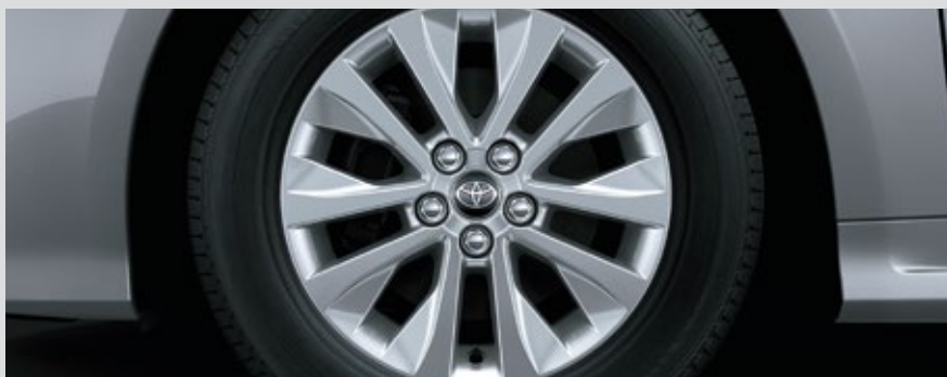
LLANTAS ARO 16"