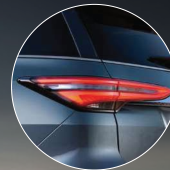
Faros traseros de LED