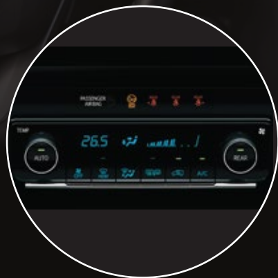
Climatizador automático digital*1