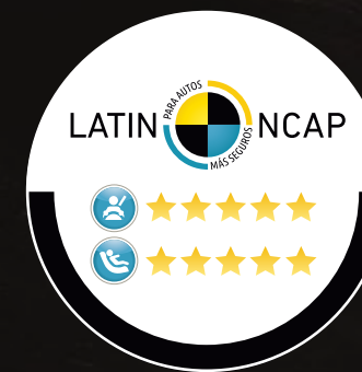
SW4 Obtuvo 5 estrellas en protección para adultos y niños