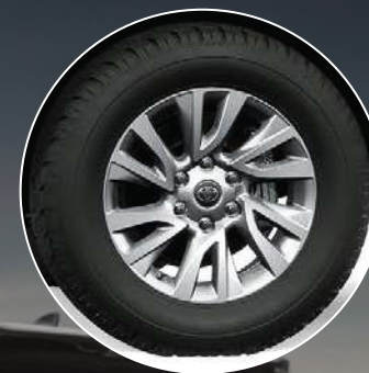
Llantas de aleación de 18"*

Ahora el motor 2,8l tiene 204 CV y las versiones con transmisión automática, 500