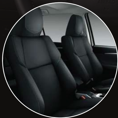
Butacas con tapizado en cuero *1

Las versiones SRX incorporan Sistema de audio Premium JBL® con 10 parlantes y subwoofer. Todas las versiones de SW4 tienen un equipo de audio con pantalla táctil de 8" y conectividad (funciona conectando el smartphone al puerto USB mediante un cable. Android Auto® > Apple CarPlay®)