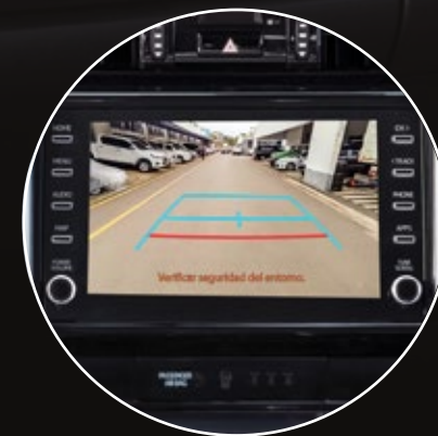
Cámara de retroceso