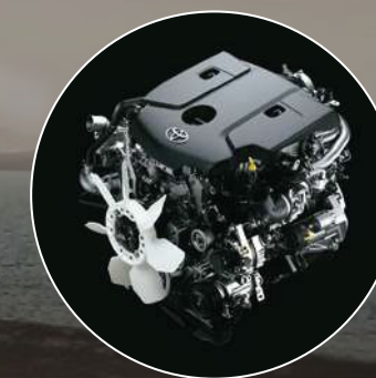
Motor 2.8l de 204 CV de potencia y 500 Nm de torque máximo*