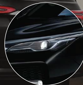
Faros delanteros Bi-LED