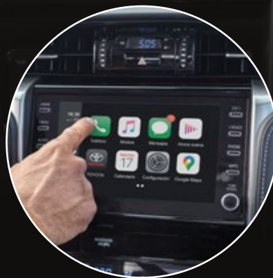
Audio con pantalla táctil de 8" y conectividad*2: Android Auto® y Apple CarPlay®