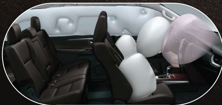
7 airbags: frontales (x2), de rodilla (conductor), laterales (x2) y de cortina (x2)