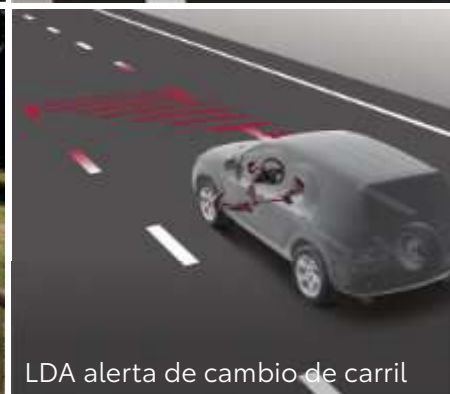
LDA alerta de cambio de carril