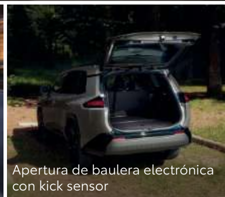
Apertura de baulera electrónica con kick sensor