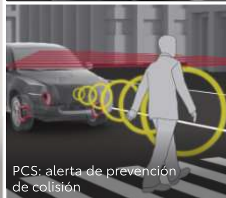
PCS: alerta de prevención de colisión