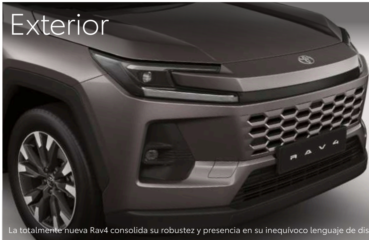
La totalmente nueva Rav4 consolida su robustez y presencia en su inequívoco lenguaje de diseño.