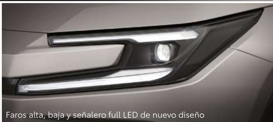
Faros alta, baja y señalero full LED de nuevo diseño