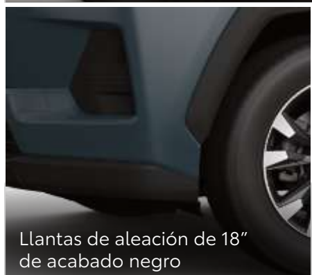
Llantas de aleación de 18" de acabado negro