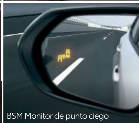
BSM Monitor de punto ciego