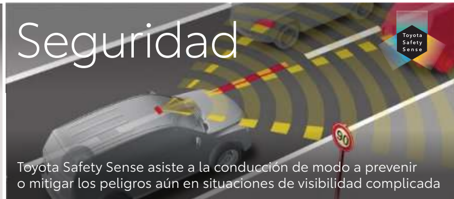
Toyota Safety Sense asiste a la conducción de modo a prevenir o mitigar los peligros aún en situaciones de visibilidad complicada