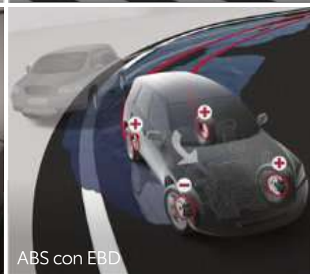
ABS con EBD