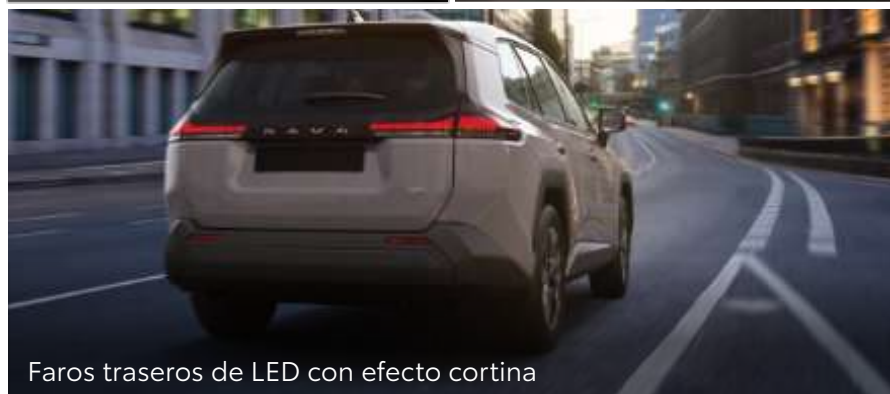
Faros traseros de LED con efecto cortina